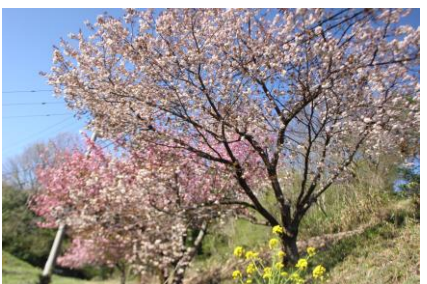
道の駅とんぼら (4月20日)