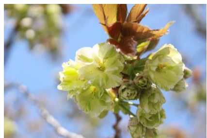
三刀屋川御衣黄 (4月8日)