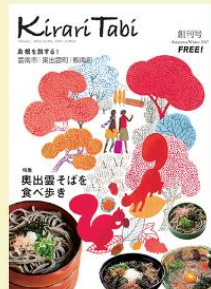
Kirari Tabi Vol.1