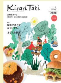
Kirari Tabi Vol.3