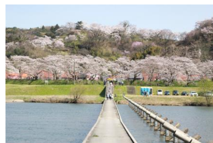
斐伊川堤防桜並木 (3月30日)