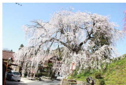
段部のしだれ桜 (3月30日)