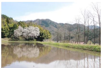
張戸お大師桜 (4月12日)