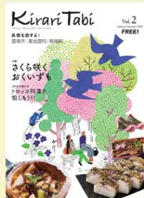
Kirari Tabi Vol.2