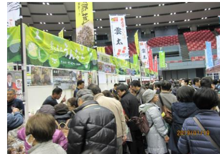
昨年のフェアの様子

今年も「島根ふるさとフェア2020」に雲南地域から美味しいご当地グルメや地酒などをたくさんお持ちします！そこで、今回のふるさと通信第49号は、島根ふるさとフェア2020、ゆうきの里雲南ブロック特集として、各市町出展業者と代表品目（価格は当日ご確認ください。）を紹介いたします。